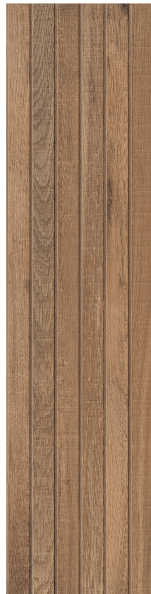
BRUNO (Brun) 30 x 120 cm (12 x 48) Fini mat Épaisseur nominale : 9.8 mm LG.WW.BRN.1248.MT

Tous les items présentés dans ce document font partie du programme d'inventaire Olympia. Pour les commandes spéciales, veuillez contacter votre représentant de Tuiles Olympia.