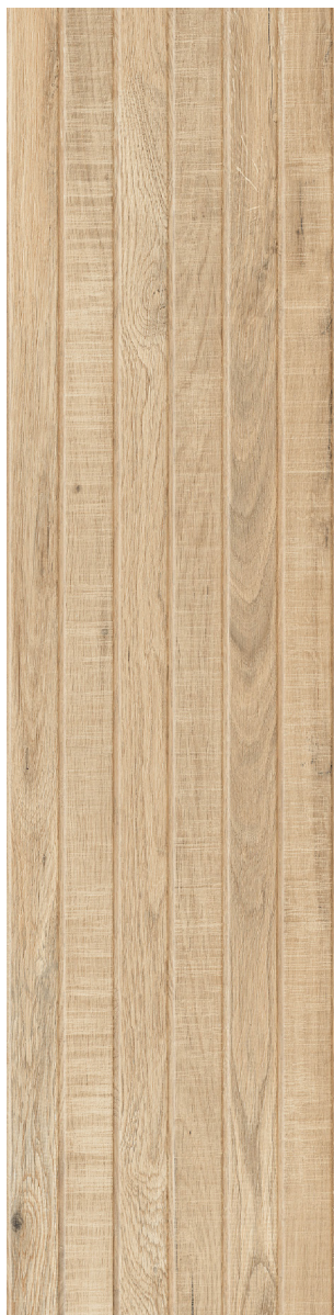
MIELE (Miele) 30 x 120 cm (12 x 48) Fini mat Épaisseur nominale : 9.8 mm LG.WW.MLE.1248.MT