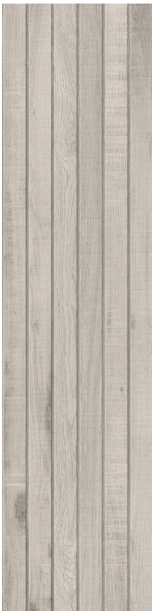
GRIS 30 x 120 cm (12 x 48) Fini mat Épaisseur nominale : 9.8 mm LG.WW.GRI.1248.MT